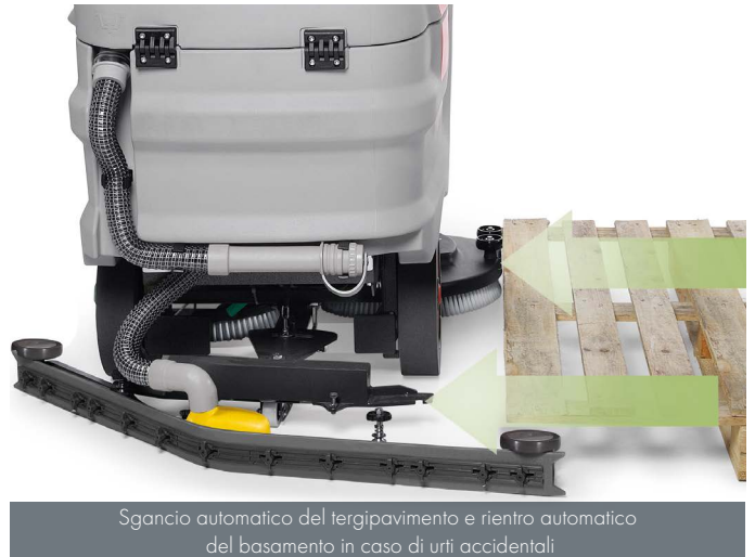
Sgancio automatico del tergilavaggio e rientro automatico del basamento in caso di urti accidentali