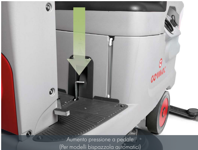
Aumento pressione a pedale (Per modelli bispazzola automatici)