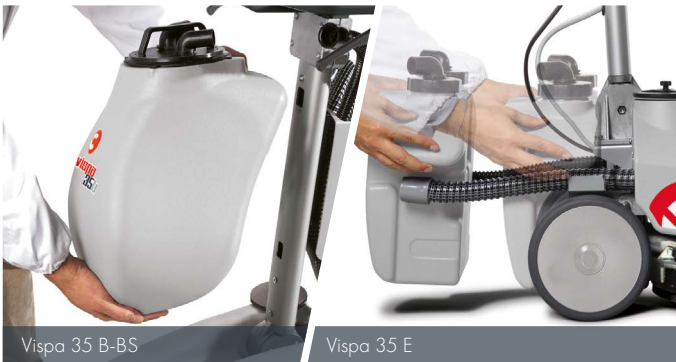
Vispa 35 B-BS

Grazie al connubio tra motore di aspirazione e tergipavimento che ruota intorno alla spazzola l'asciugatura è perfetta anche nelle curve.